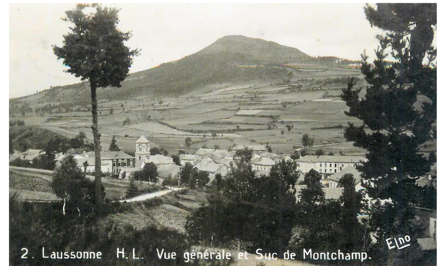
2. Laussonne H. L. Vue générale et Suc de Montchamp.